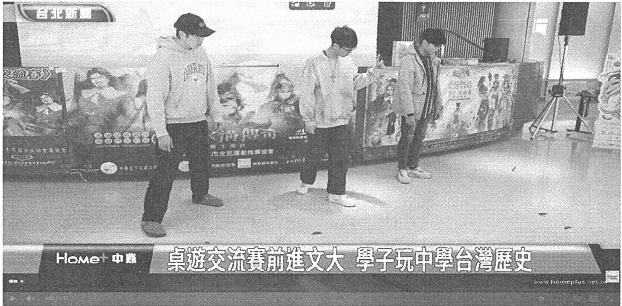
桌遊交流賽前進文大 學子玩中學台灣歷史